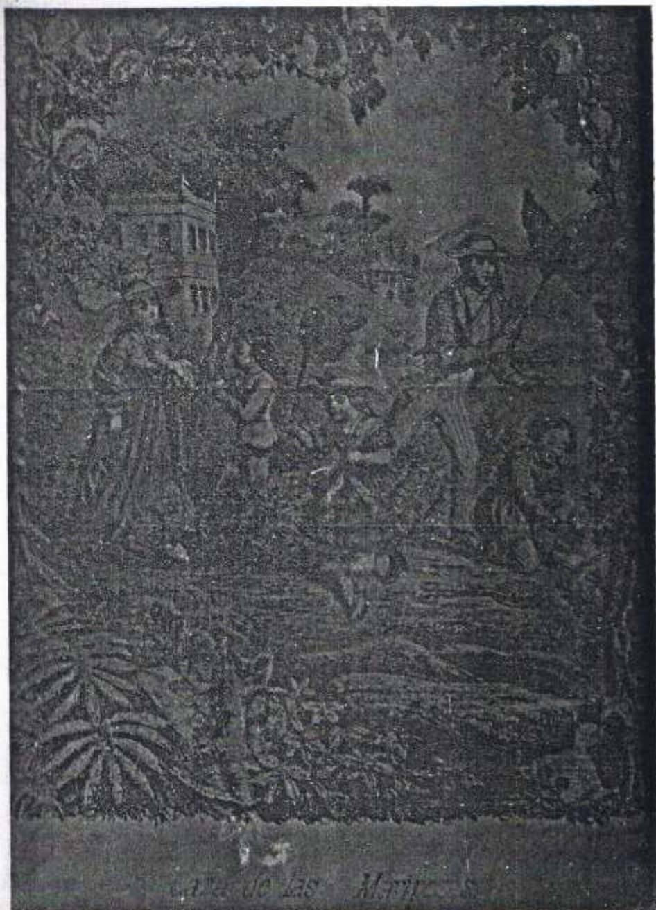
La ciencia recreativa , vol. VI, Zoología, t. II, 1873.