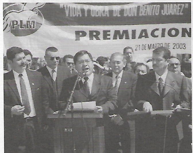
21 de marzo del 2003, Ceremonia de Premiación del Primer Concurso de Ensayo sobre la Vida y Obra de Don Benito Juárez

Cabe recordar que la manera de hacer historia para ese momento, sitúa al autor como uno de los herederos de la narración de corte política, es decir, tiene toda la concepción del siglo XIX. Las proezas y los fracasos son el resultado de las actuaciones de los grandes hombres, de esta postura es fiel seguidor e indiscutiblemente con ella se formó. Aquellos que se quedaron en el camino de las buenas intenciones. Los que no tiene la grandeza, no deben entrar a la historia ¿Es el caso de Juárez?