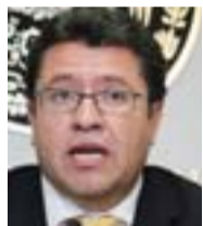
RICARDO MONREAL, diputado

En cruzada por los usuarios de la banca. En lo que va de la