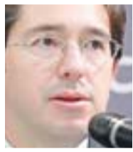
DIONISIO PÉREZ-JÁCOME. De la SCT

Negocio ilícito. en carreteras federales. Quienes pensaron que el negocio del desvío de recursos en las casetas de cobro de Caminos y Puentes Federales es un verdadero negocio, se quedaron cortos. Personal de la Secretaría de Comunicaciones y Transportes (SCT), que encabeza Dionisio Pérez-Jácome, nos asegura que la danza ilícita de millones de pesos se da en los contratos para el mantenimiento de la red federal carretera. Por sólo citar un ejemplo, para adquirir un contrato, las empresas tienen que entregar a funcionarios 10% del valor del mismo, de lo contrario pueden quedar fuera de futuras licitaciones, eso nos cuentan.