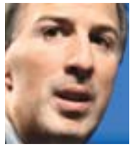
JOSÉ MEADE. De Hacienda

Van por apoyos para Europa. José Antonio Meade llegó a Washington para la reunión del G-20 con la idea de que continué la discusión sobre más apoyos a Europa. El secretario de Hacienda considera que aunque hay una mejoría en el clima europeo, es necesario reforzar las medidas de apoyo. Pero también lleva bajo el brazo el planteamiento de que se impulsen reformas de nueva generación. En la agenda de Meade se encuentran reuniones con Christine Lagarde, directora gerente del FMI; Roberto Zoellick, presidente del Banco Mundial, y José Ángel Gurría, secretario general de la OCDE. También encabezará una reunión con ministros de Finanzas de Centroamérica.