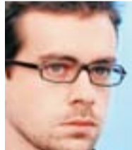
JACK DORSEY. De Twitter

Venden seguidores. La firma Shopatía Technologies ofrece la venta de seguidores en Twitter, que dirige Jack Dorsey, o "Me gusta" en Facebook por cierta cantidad de dinero. Por ejemplo, por 100 seguidores en Twitter cobra 20 dólares, por 75 mil cobra 500 dólares; por 500 "likes" en Facebook cobra 30 dólares, por 5 mil "likes" cobra 230 dólares. El pago puede hacerse vía tarjeta de crédito, vales Sí Vale, e incluso en tiendas Oxxo. Una vez realizado el pago los seguidores o "Me gusta" comenzarán a descargarse poco a poco luego de 24 horas.