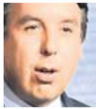
EMILIO AZCÁRRAGA. De Televisa