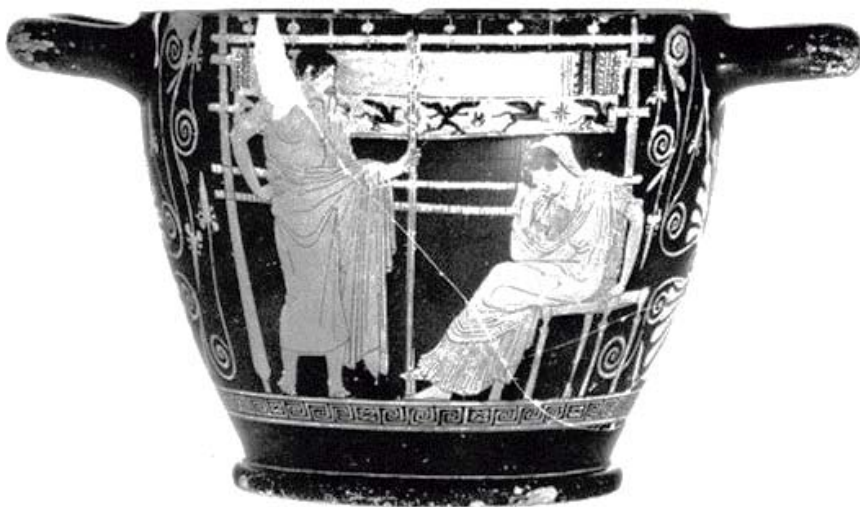
IMAGEN 3. “Penélope ante su telar”. Skyphos de figuras rojas (Hauser). Italia, Chiusi. Col. Chiusi, Museo Archeologico Nazionale: 63.564. BADN: 216.789. 450-400 a.e.

monio y el obligado abandono del oikos de Odiseo. La reina de Ítaca decidió levantar un gran telar en el palacio, específicamente, en su habitación, “preparando un sudario para Laertes, pero, de día, tejía, mientras por la noche destejía lo hecho (cf. imagen 3); una de las esclavas reveló lo que ocurría; descubierto todo, la reina había tenido que acabar el sudario a la fuerza”. 23 Telémaco, pese a los consejos de Antínoo, no puede echar a su madre del palacio obligándola a casarse con otro.