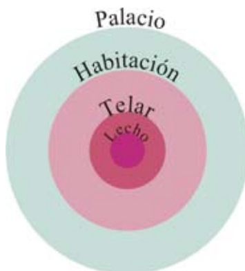
IMAGEN 5. “El espacio de Penélope”, realizada por la autora.