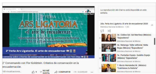
Presentaciones de la 2ª Feria, modalidad virtual.

Para la 4ª Feria Ars Ligatoria esperamos poder reunirnos también de manera presencial.