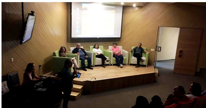
Plenario de la 1ª Feria.

Aunque todo aquel que participa y se interesa por la encuadernación y las artes del libro, gusta de hacerlo presencialmente, ya sea cuando asistes o impartes un curso,