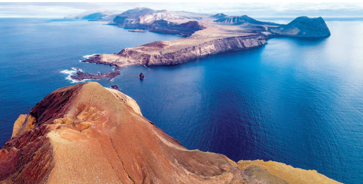
Vista panorámica de la isla Guadalupe, tomada desde el islote Toro, en la reserva de la biosfera de la isla.

del “cine de oro mexicano” con Pedro Infante como protagonista 4 contribuyeron a la consideración de esta isla como un lugar de trabajos forzados, imagen que perduró en el imaginario colectivo durante décadas, a pesar de que era un penal sui generis en el que los reos podían llevar a vivir consigo a sus parejas e hijos menores de once años. Al desaparecer recientemente el penal (marzo de 2019), los “muros de agua”, nombrados así por el escritor y activista social José Revueltas, cuando evocaba las barreras que cercaron por años a María Madre, lo seguirán siendo, pero de un centro cultural.