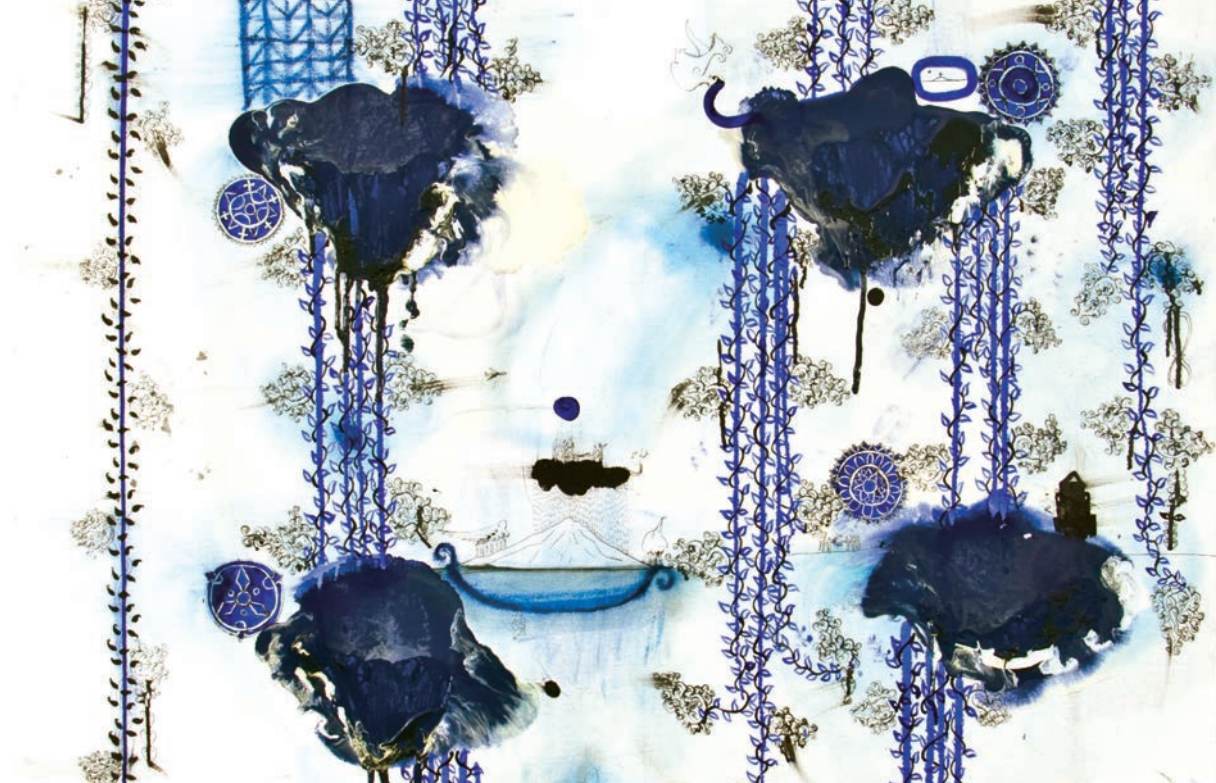
John Pule, Hopo Viki , 2007.

te en el espacio submarino de algunas islas cercanas al litoral, como Magdalena y Santa Margarita, en Baja California Sur se han hallado pecios 2 de diferentes momentos históricos cuyo patrimonio es una mina para los arqueólogos subacuáticos y los buscadores de tesoros. Algunos pescadores de la zona podrían tener una idea al respecto o resguardar los secretos que se esconden bajo las aguas.