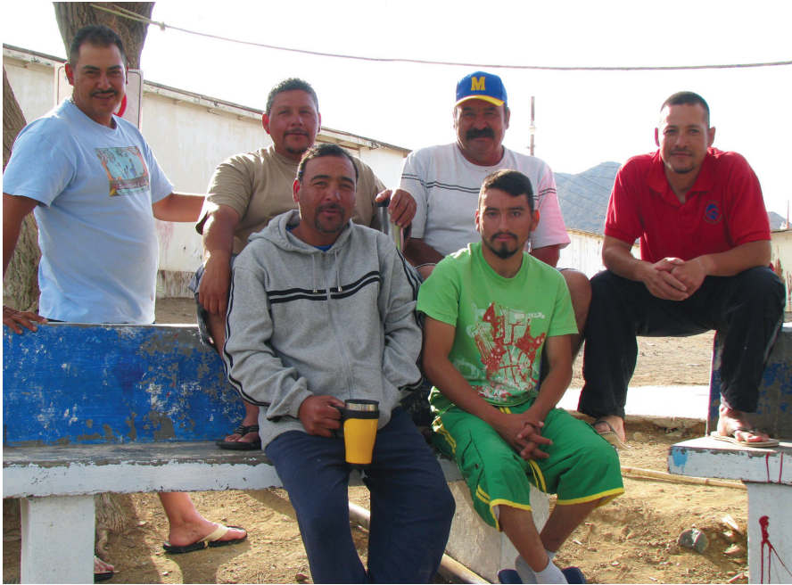
Figura 2. Buzos de abulón en el campo pesquero de Punta Norte, Isla de Cedros, Baja California.