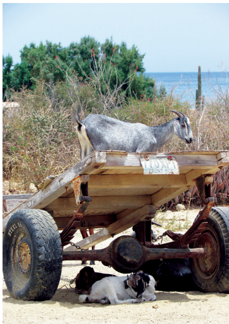
Figura 5. Ganadería caprina en La Palma Sola, Isla San José, Baja California Sur.