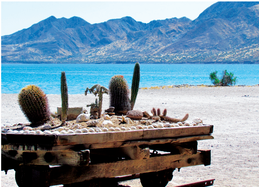
Figura 4. Reutilización de una carreta de sal de manera ornamental en Isla El Carmen, Baja California Sur.