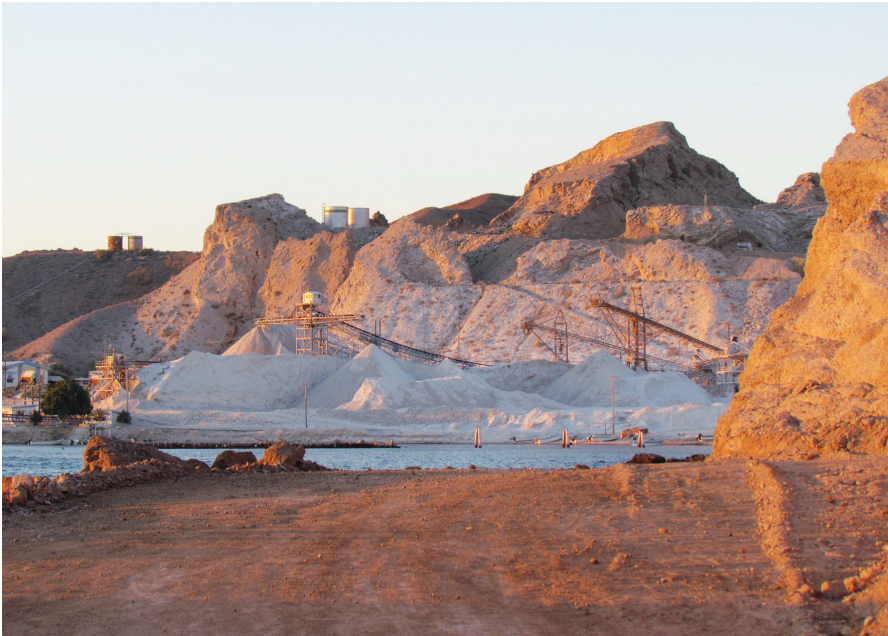
Figura 3. Yacimiento de yeso de la isla San Marcos, Baja California Sur.