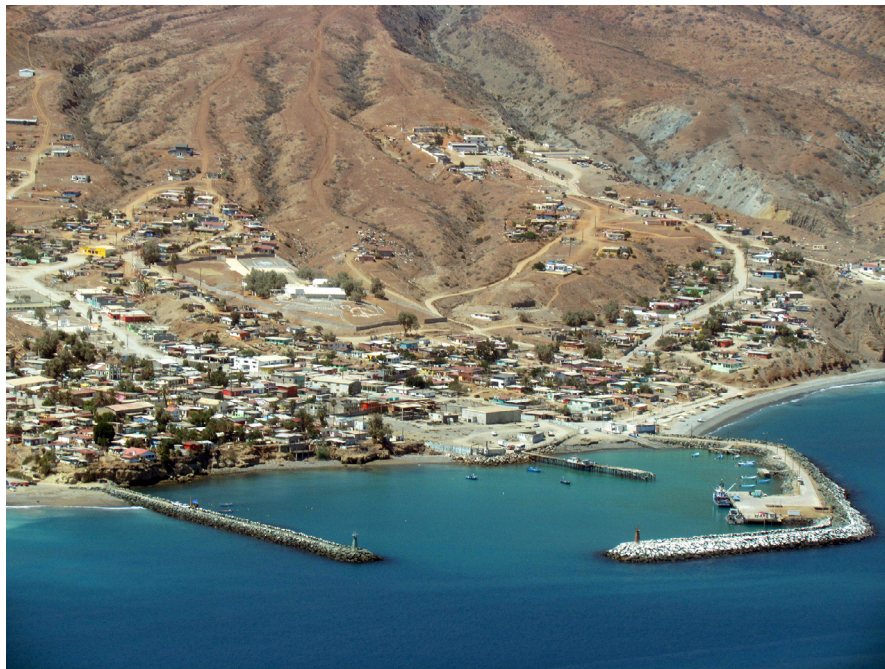
Figura 4. Los dos asentamientos de la Isla de Cedros son el pueblo de pescadores en el litoral este (izquierda) y El Morro en la Punta sureste (derecha).

Cuando la “Pesquera del Pacífico” terminó sus funciones en los años 90, la emigración causó efectos en la demografía y en la economía local: muchas personas se fueron a otras ciudades de Baja California, principalmente a Ensenada, donde se encuentra una gran cantidad de isleños, negados a desarraigarse de “El Piedrón”, topónimo alternativo y no oficial. El censo más reciente (2010) reporta una población de 2 mil habitantes entre ambas localidades de la isla de Cedros (fig. 4).