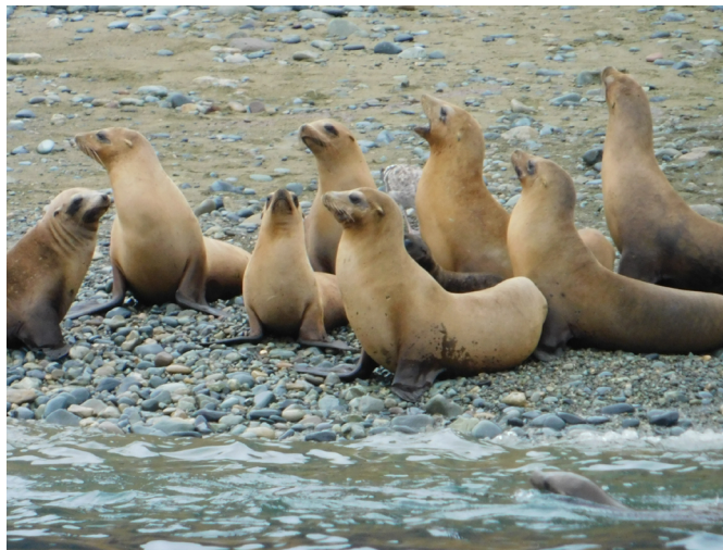
Figura 3. Aún se observan lobos marinos en Punta Norte a pesar de su disminución en el siglo XIX. Fotografía: Israel Baxin, 2018

Posteriormente, en la última década del siglo XIX y la primera del siglo XX, una compañía minera estadounidense obtuvo permisos del gobierno mexicano para la extracción de oro y cobre en la Punta Norte. Se estableció un campamento donde además de las construcciones e infraestructura necesaria llegaron a vivir hasta 80 trabajadores, más los visitantes eventuales (Núñez & Méndez, 2016). Esta actividad originó severas transformaciones en el paisaje insular en una de las zonas de mayor diversidad biológica, debido a los cambios altitudinales y climáticos.