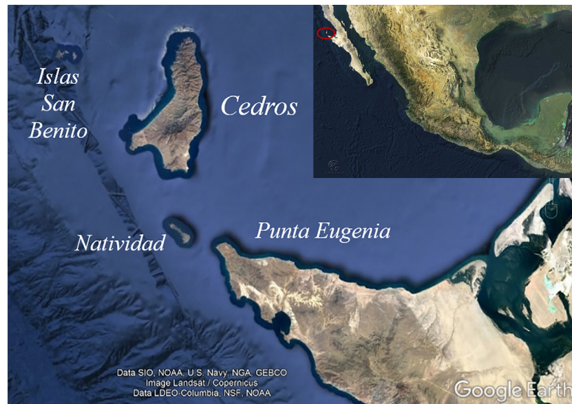
Figura 2. El archipiélago denominado Islas de San Esteban por Ulloa (1540) e Islas de los Dolores por Taraval (1733). Elaboración propia con base en CONABIO y Google Earth, 2019

A pesar de que la península de Baja California fue visitada desde el siglo XVI por navegantes como Rodríguez Cabrillo (1542) y Vizcaino (1602-1603), esos exploradores y otros únicamente escribieron relaciones de su experiencia en la búsqueda de recursos naturales tales como el oro y las perlas, en las que narraban la resistencia de los indígenas frente a los extranjeros.