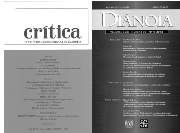
Revistas del Instituto de Investigaciones Filosóficas