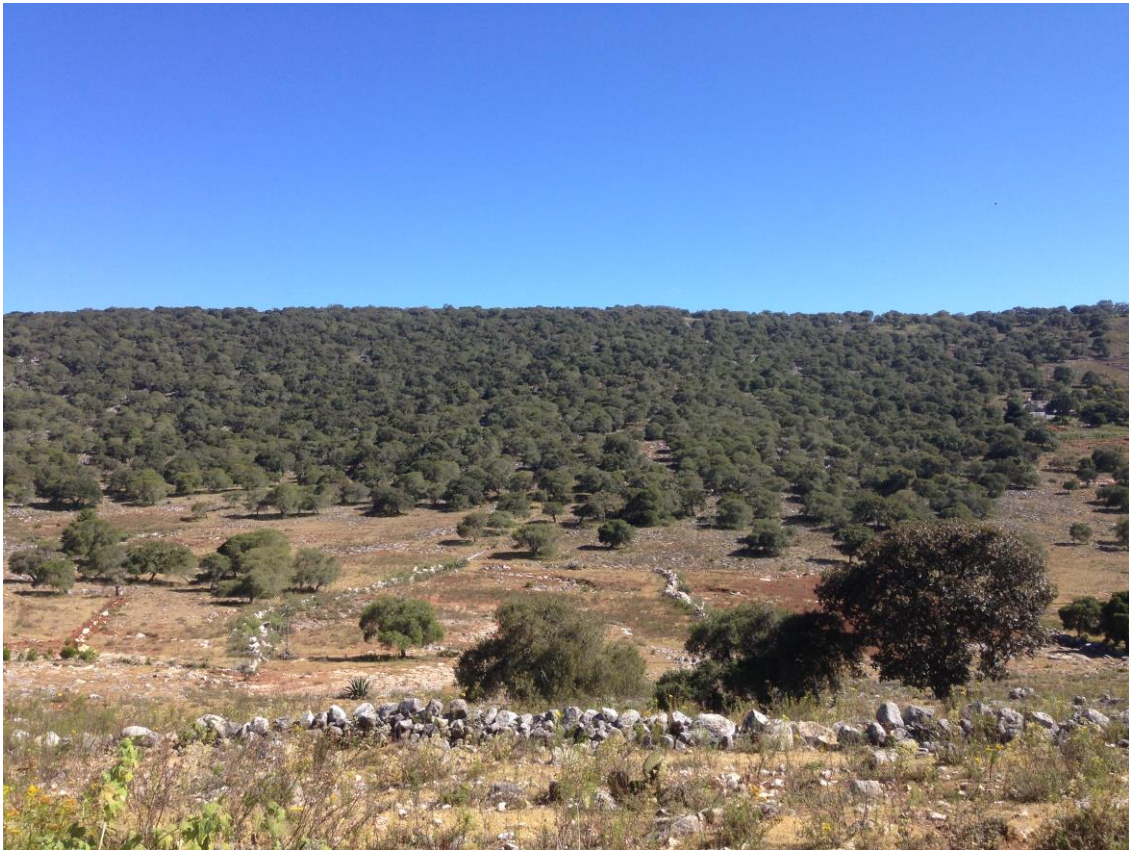
Figura 1. Paisaje de bosque de encino parcialmente deforestado para uso agrícola en San Juan Bautista Coixtlahuaca, Oaxaca. (Fotografía: Francisco Guerra Martínez).

En la práctica, la resistencia se entiende como una interrupción, durante el disturbio, en la reducción del atributo analizado (Lloret et al. , 2011) y se puede estimar a través de la relación entre el valor que adopta el atributo antes y durante el disturbio. Por su parte, la recuperación se visualiza como un aumento en el valor del atributo analizado que ocurre después del disturbio, se estima como la relación entre el valor de la variable analizada durante y después del disturbio (Lloret et al. , 2011) (Figura 2).