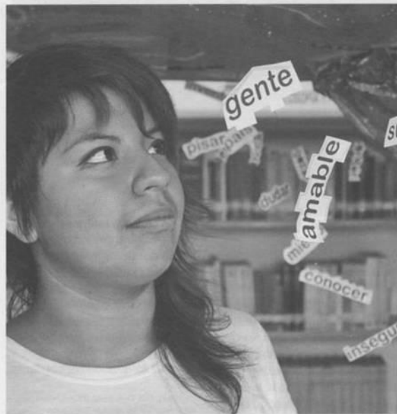
Instalación Lluvia mental (detalle).

Este es el caso de la obra que elegí: La metamorfosis de Franz Kafka. Ha sido uno de los primeros libros que me impactaron y que, con el paso del tiempo, he ido asimilando de manera totalmente diferente. Ahora que ya estoy inmersa en el ámbito laboral, tengo las mismas