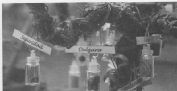
Instalación El árbol de palabras vivas (detalle).

El Premio Internacional de Ensayo de la Fundación Caballero Bonald, fue entregado en España al escritor mexicano Enrique Krauze por su obra Redentores: ideas y poder en América Latina , en el que presenta doce figuras como Eva Perón o "los cuatro José" (Martí, Rodó, Vasconcelos y Mariátegui), el teólogo Samuel Ruiz, el subcomandante Marcos, y el poeta Octavio Paz, que funciona como "espina dorsal", y quien subrayaba el hecho de que en él "las protagonistas son las ideas, pero no las abstractas, sino las encarnadas en hombres y mujeres con amores y odios, con momentos de exaltación y de miserias", comentó el autor. El galardón, compuesto de 20 mil euros (unos 26 mil dólares) y convocado por la Biblioteca Virtual Miguel de Cervantes, el Banco Santander y el Ayuntamiento de Jerez, representa para Krauze "un avance hacia el reconocimiento de la dignidad del ensayo, género tan importante en nuestra lengua que se ha dejado un poco de lado frente a la poesía y la novela".