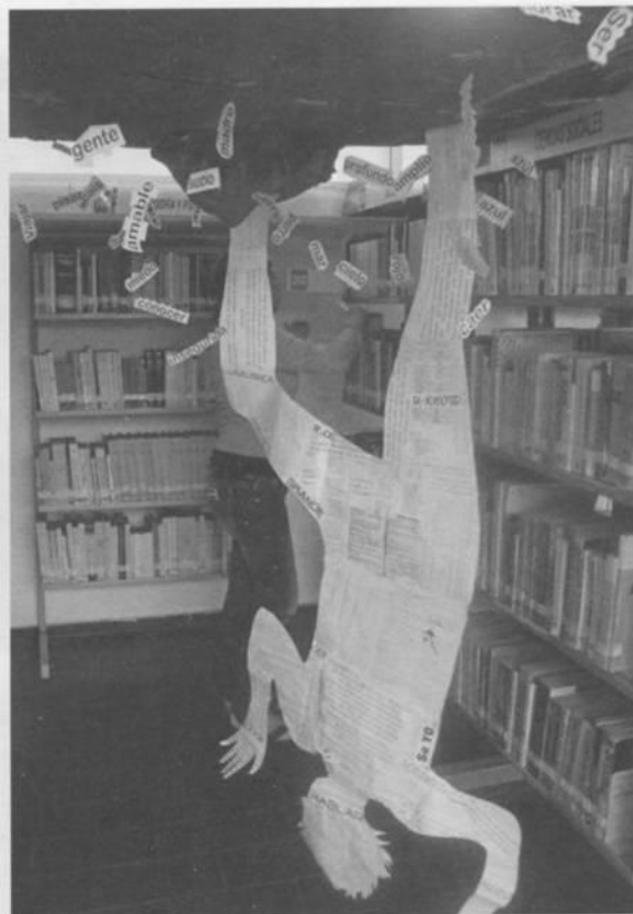
Instalación Luz y mental .

resulta fundamental, ya que en las múltiples prácticas de lectura está el uso de textualidades impresas, visuales y audiovisuales, mismas que conforman los mapas de la reproducción simbólica y cultural de la sociedad en la actualidad. Por ello es importante que la biblioteca pública incorpore mediaciones artísticas y