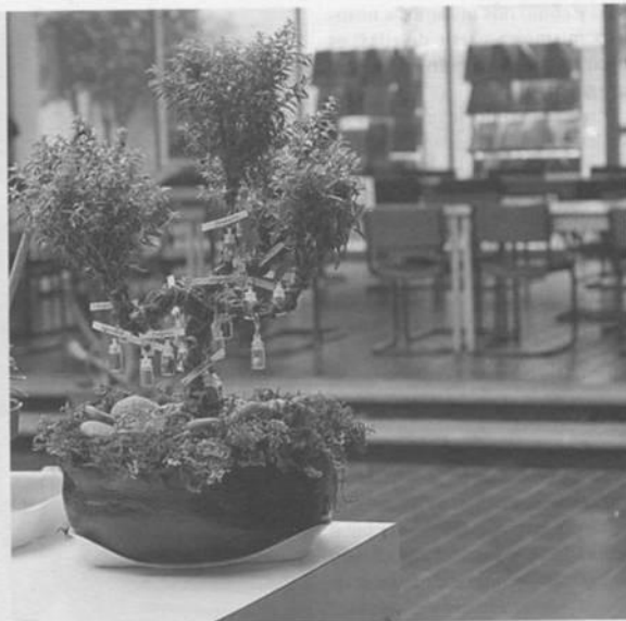
Instalación Mi árbol de palabras vivas .