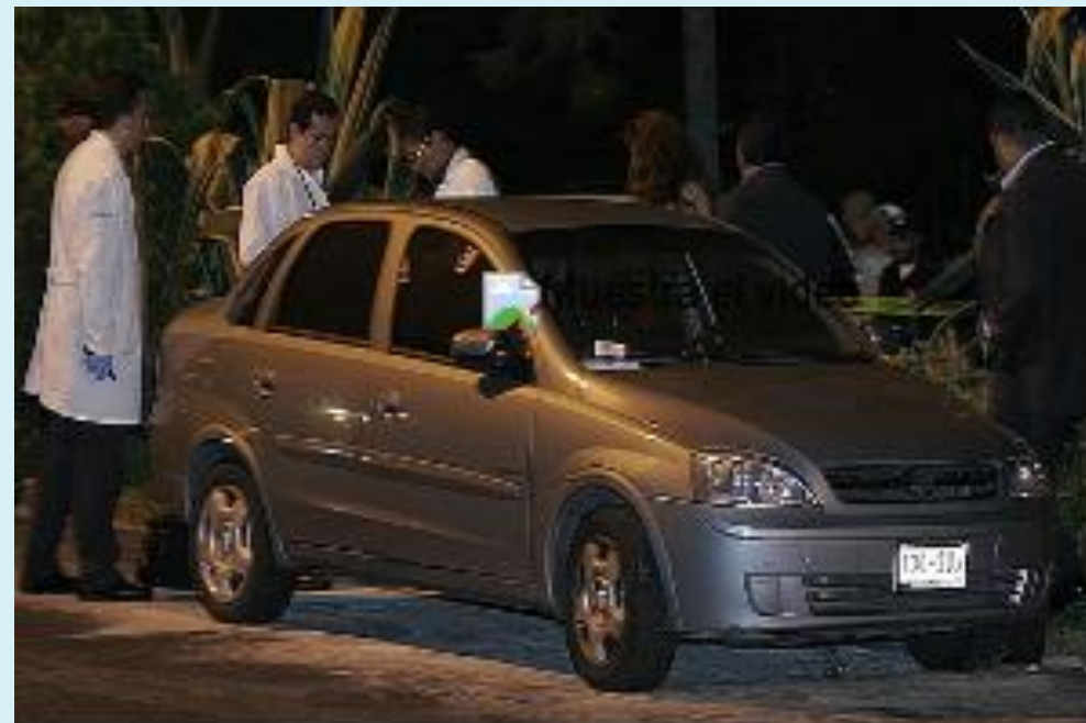
Video 'Estuve en el auto que subieron a Fernando Mart'.